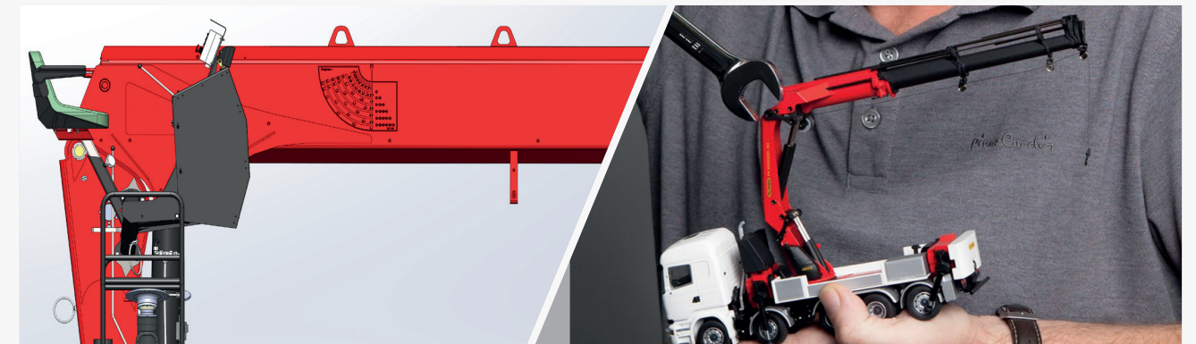
6-гранное сечение профиля стрелы Высокие прочностные характеристики