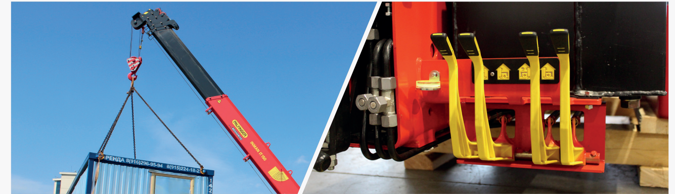
Максимальная грузоподъемность более 7 т Грузоподъемность увеличена на 450 кг