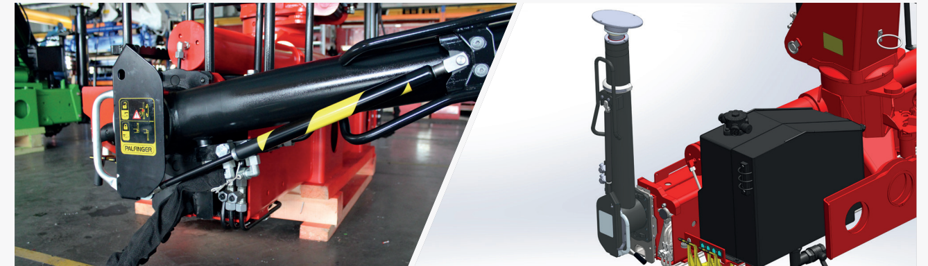
Опоры с ручным поворотом и пневмоцилиндрами Безопасность и удобство в процессе эксплуатации